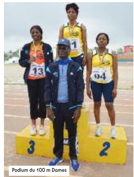
Podium du 100 m Dames