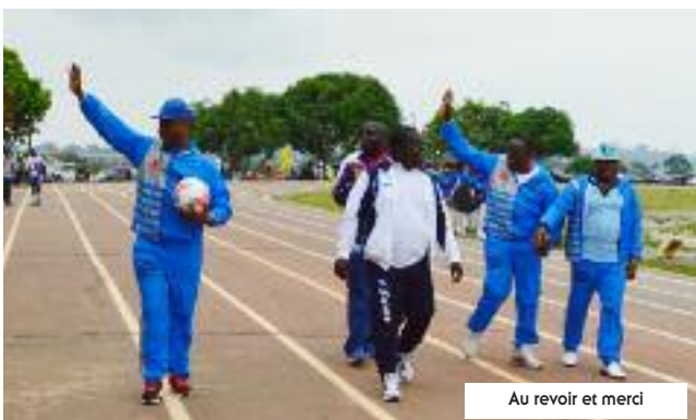
Au revoir et merci