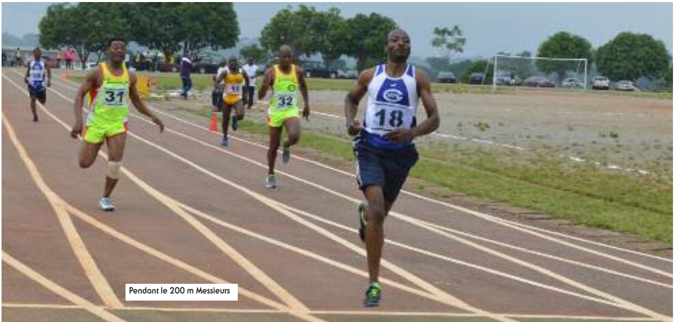
Pendant le 200 m Messieurs

Tous les chiffres des troisièmes olympiades de la CNPS qui se sont déroulées du 27 au 28 mai 2016 au complexe sportif de l'université de Yaoundé II-Soa.