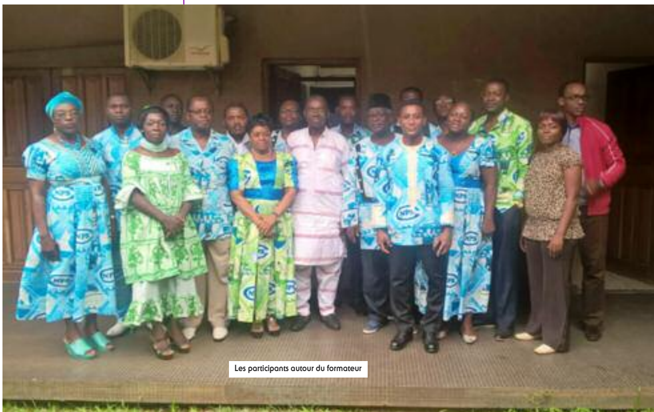
Les participants autour du formateur

Elus en mars dernier et officiellement en fonction depuis le 1er mai, ils ont participé à un séminaire sur le thème : « Le délégué du personnel : mission et rôle, droits et obligations », qui a pris fin vendredi 13 mai 2016.