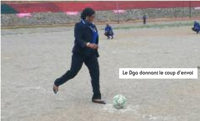
Le Dga donnant le coup d'envoi