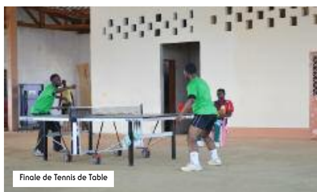
Finale de Tennis de Table