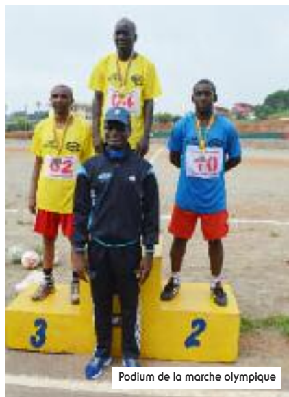
Podium de la marche olympique