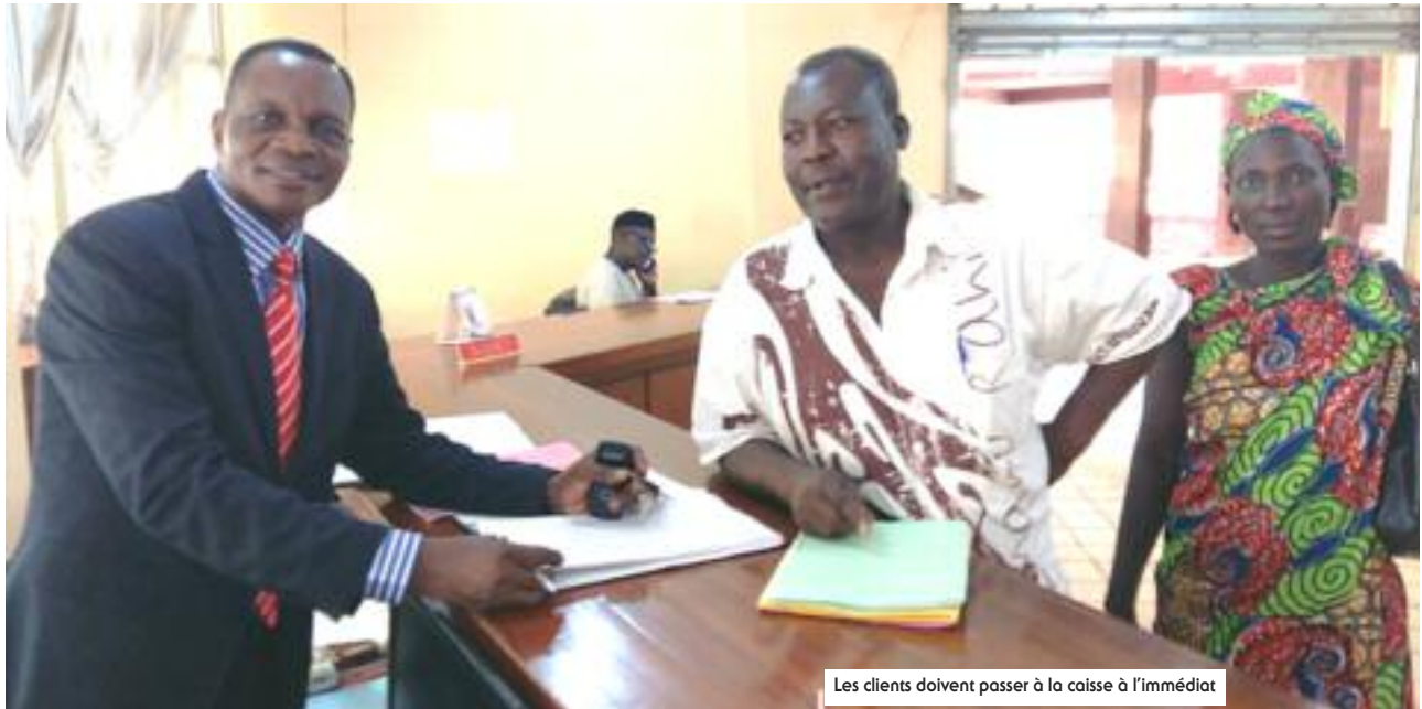
Les clients doivent passer à la caisse à l'immédiat

La mesure a été prise le lundi, 27 juin 2016 par le patron de la CNPS, qui a signé la note de service qui améliore davantage la qualité de service au profit des clients de l'organisme. Détails de cette innovation.