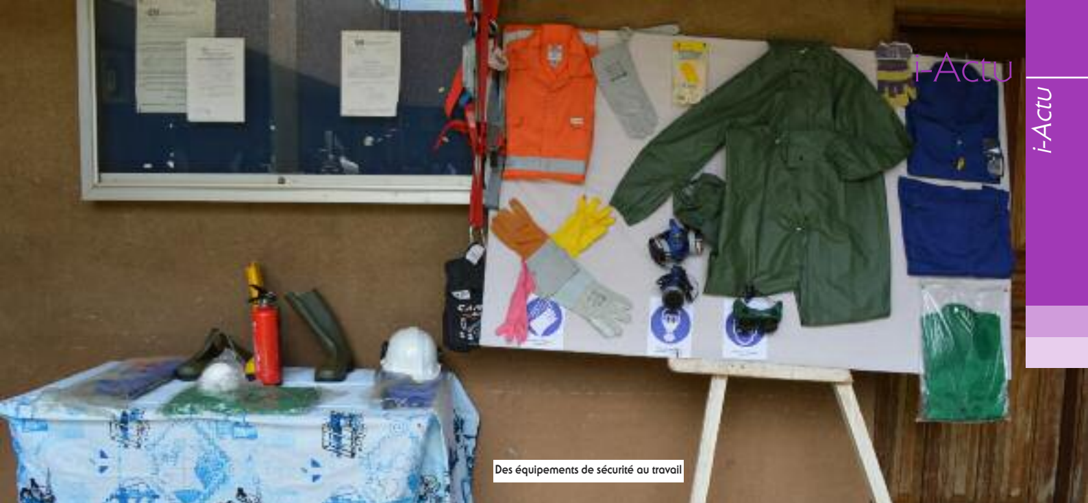
Des équipements de sécurité au travail