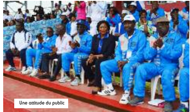
Une attitude du public