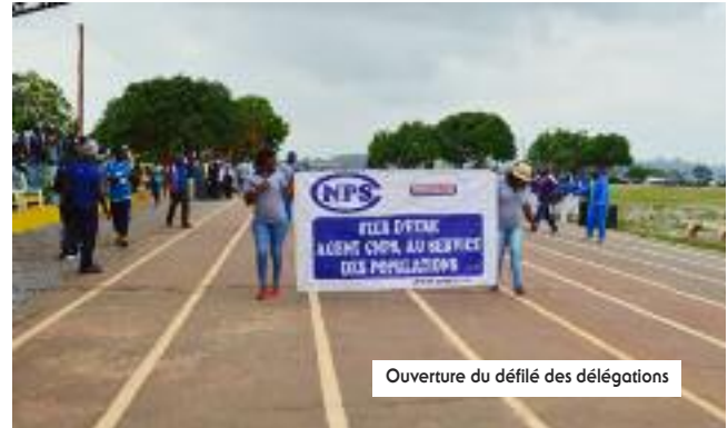
Ouverture du défilé des délégations