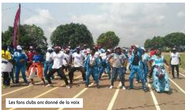
Les fans clubs ont donné de la voix