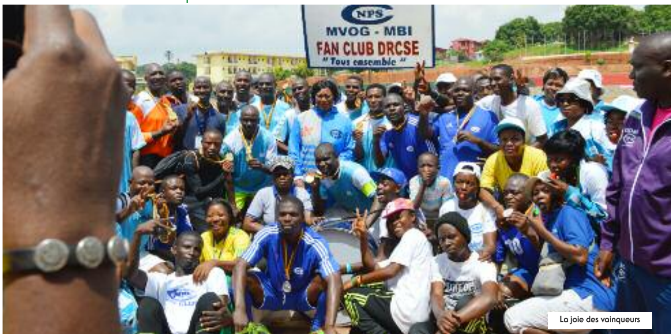
La joie des vainqueurs