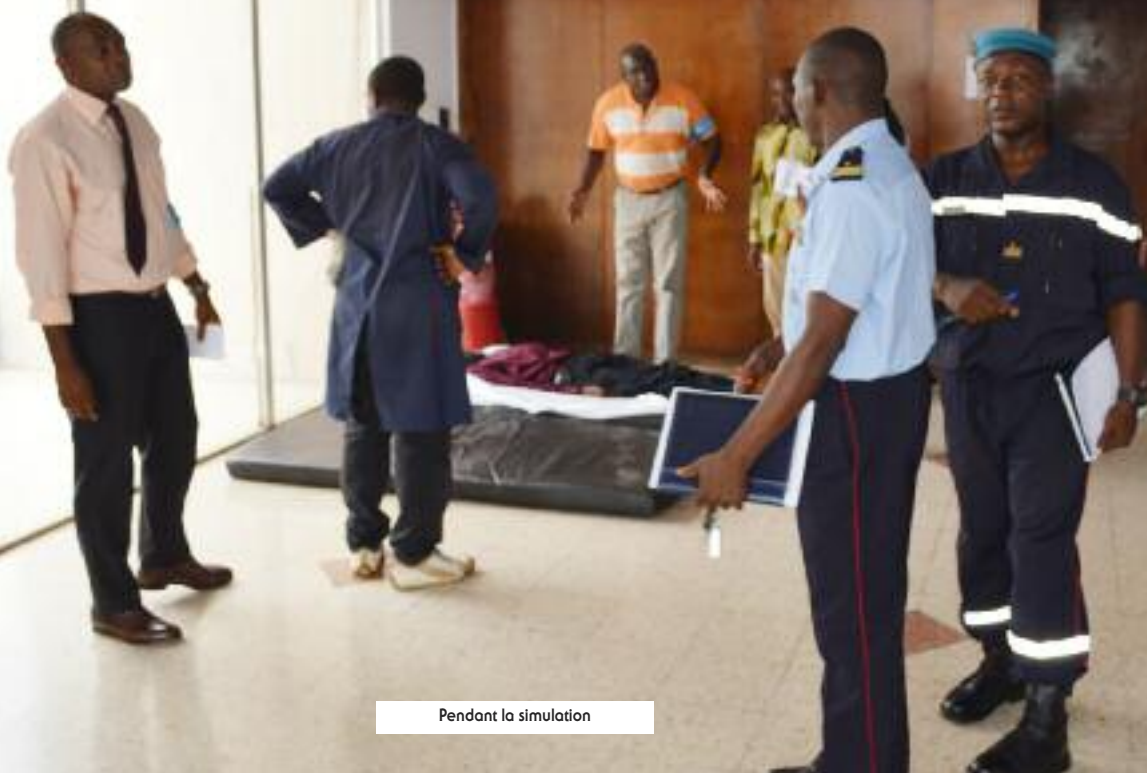
Pendant la simulation