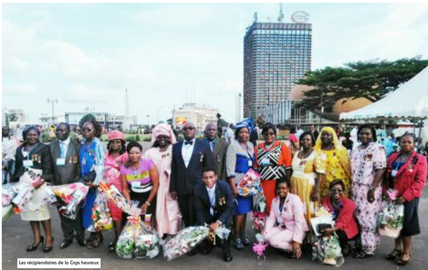
Les récipiendaires de la Cnps heureux

Le 20 mai 2016, 141 personnels de la Cnps ont reçu du gouverneur de la région du Centre : 205 médailles, dont 75 en argent, 50 en vermeil et 80 en or dans une joie bien méritée.