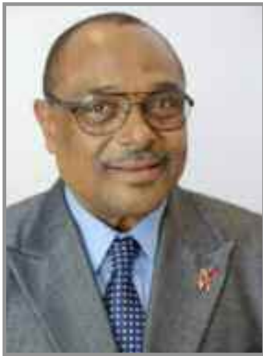
Grégoire OWONA Ministre du Travail et de la Sécurité sociale