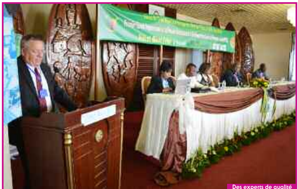
Des experts de qualité

Relativement aux prestations fournies, le fonctionnaire allemand bénéficie de la pension de vieillesse accordée après 5 années de service, son taux ayant été fixé à 35%, la pension d'invalidité et la pension allouée aux survivants. Elles sont composées de deux éléments, notam-