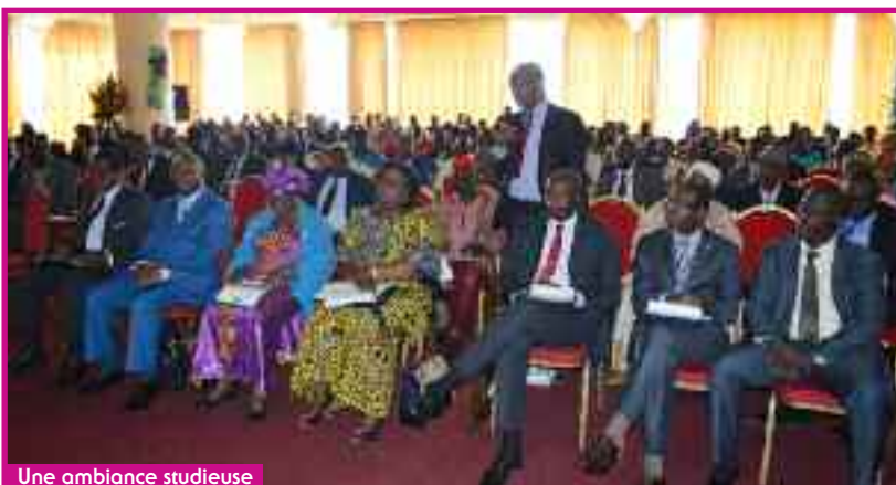
Une ambiance studieuse