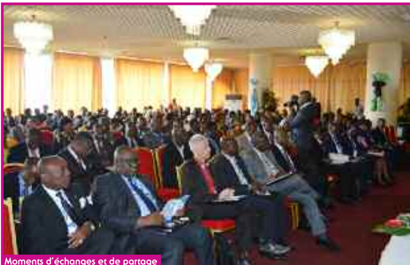
Moments d'échanges et de partage

Le Cameroun s'est donné les moyens de faire face au déficit de couverture sociale en créant une assurance volontaire. En 18 mois, 113 mille personnes ont été couvertes.