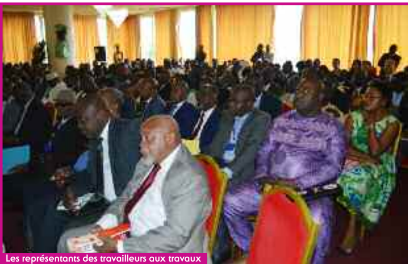
Les représentants des travailleurs aux travaux

Le Cameroun s'est donné les moyens de faire face au déficit de couverture sociale en créant une assurance volontaire. En 18 mois, 113 mille personnes ont été couvertes.