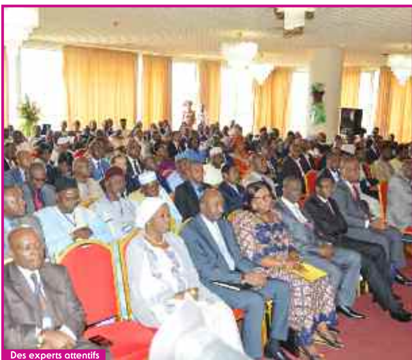
Des experts attentifs

Fort de ce constat, il a été recommandé de: i) rétablir et de maintenir l'équilibre financier du régime et assurer sa pérennité ; ii) accroître de façon significative le niveau des pensions servies à travers un réajustement de l'ensemble des paramètres techniques de gestion du régime et de rendre le dispositif de prise en charge plus attractif notamment pour les professions libérales et les chefs d'entreprise ; iii) mettre en place un régime complémentaire de retraite qui permettrait à ceux ayant des revenus supérieurs au plafond en vigueur de cotiser, sur une base obligatoire ou volontaire jusqu'à un certain seuil ; iv) avoir des réformes davantage politique, ce qui suppose de définir une vision ou un modèle qui servira de canevas pour la conduite de la réforme ; v) lutter contre la pauvreté monétaire, en définissant un seuil minimum ; vi) préserver le niveau de vie antérieure étant entendu que le système à venir devrait pouvoir permettre de garder le revenu qu'une personne avait lorsqu'elle travaillait (régime contributif à des niveaux divers) ; vii) promouvoir le bien-être social en garantissant à tous un standard de vie après son départ à la retraite, un revenu fixe.